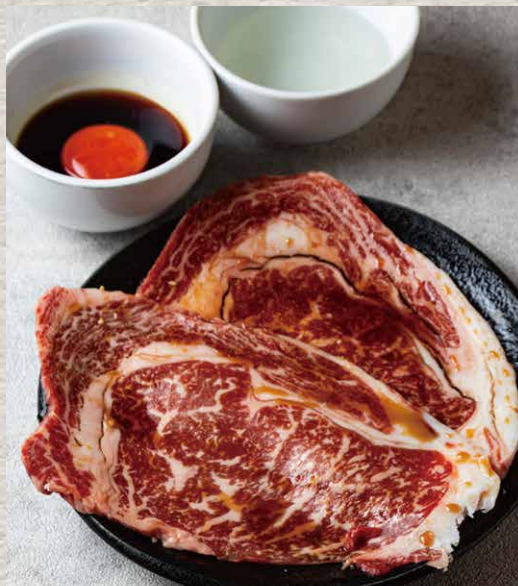
黒毛和牛の サーロイン焼きしゃぶ 1990 (税込2189)

KUROGE WAGYU Sirloin Roasted Shabu-Shabu