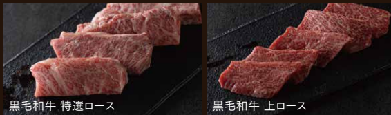
黒毛和牛 特選ロース