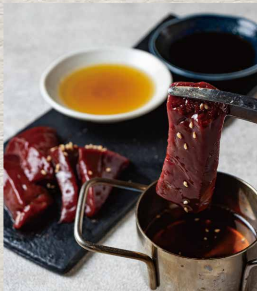
レバしゃぶ 1190 (税込1309)

きめ細かくやわらかなサーロインを軽くロースターで焼き、洗いダレ、卵黄のソースでお召し上がりいただく逸品。