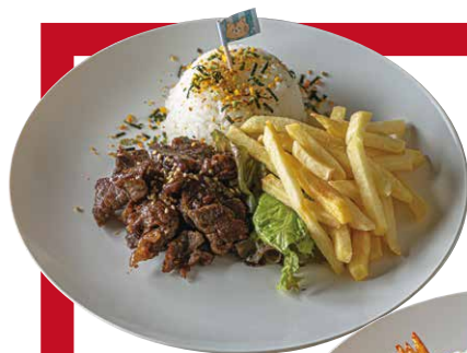
◀ お子様焼肉セット